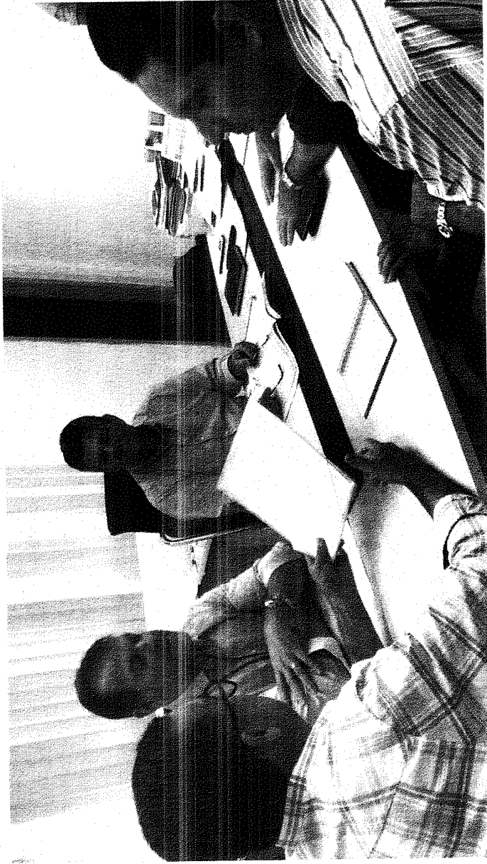
Até semana que vem uma comissão definida por Sedet, Crea, SPU e Semscs deverá concluir levantamento sobre primeiros prédios a serem vistoriados