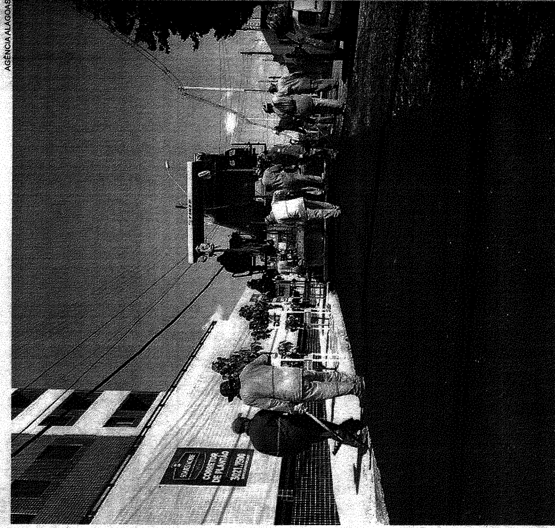
Recapeamento será realizado em 16 ruas que compõem o Eixo Quartel nos bairros da Gruta, Pitanguiinha e Farol